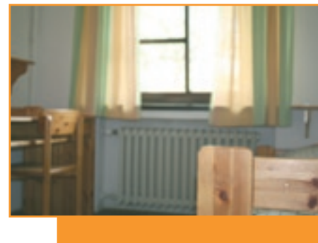
Klein aber mein: Der Privatbereich gibt Raum zum Entspannen.